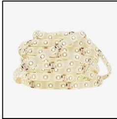
BRILIA Fita de LED